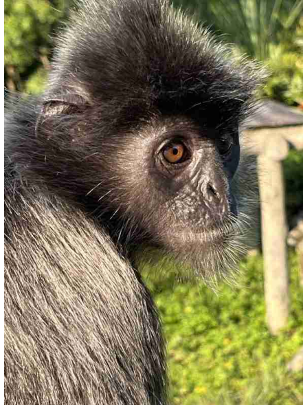
Le macaque argenté

Le secret pour réussir ce genre de voyage, c'est de se faire accompagner par un bon guide local.