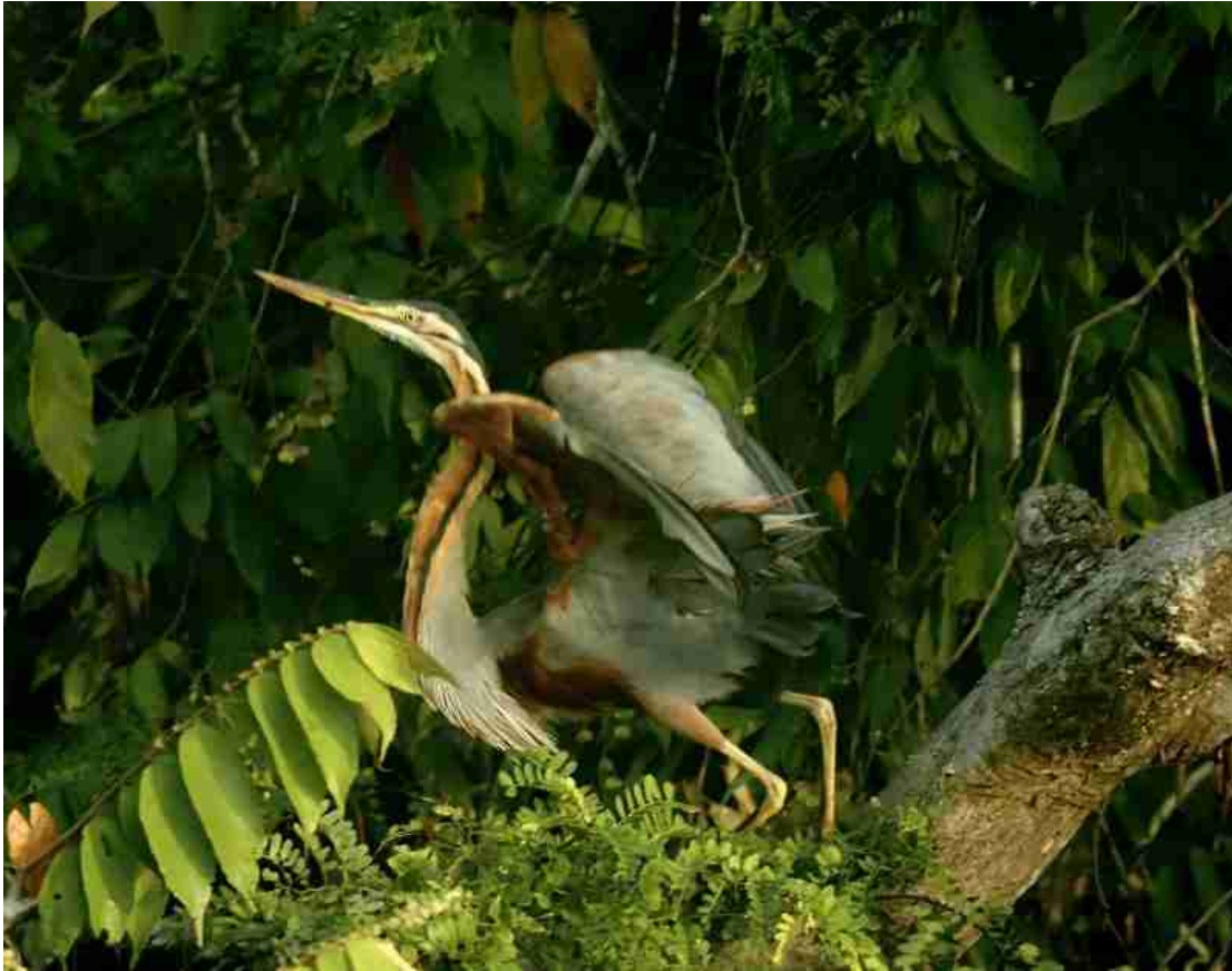
Majestueux au décollage