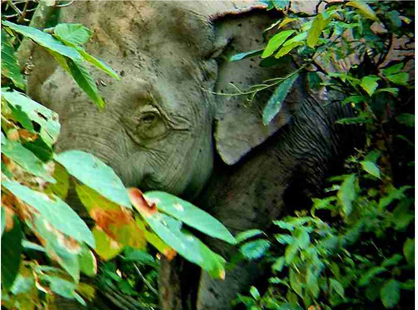
Madame s'était cachée