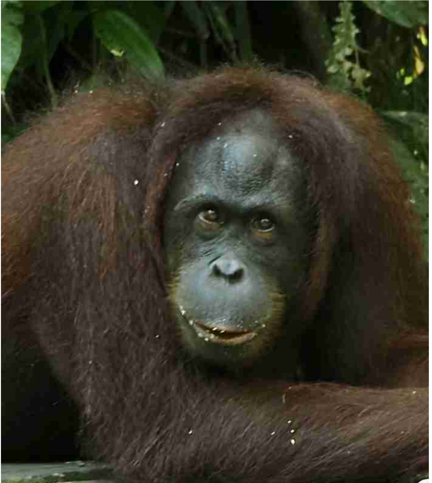
Quoi ma gueule