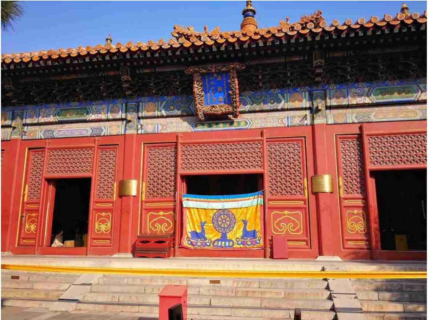
Temple des lamas

impressionnante et il va falloir faire la queue. Donc préférez un jour de semaine pour ce parc.