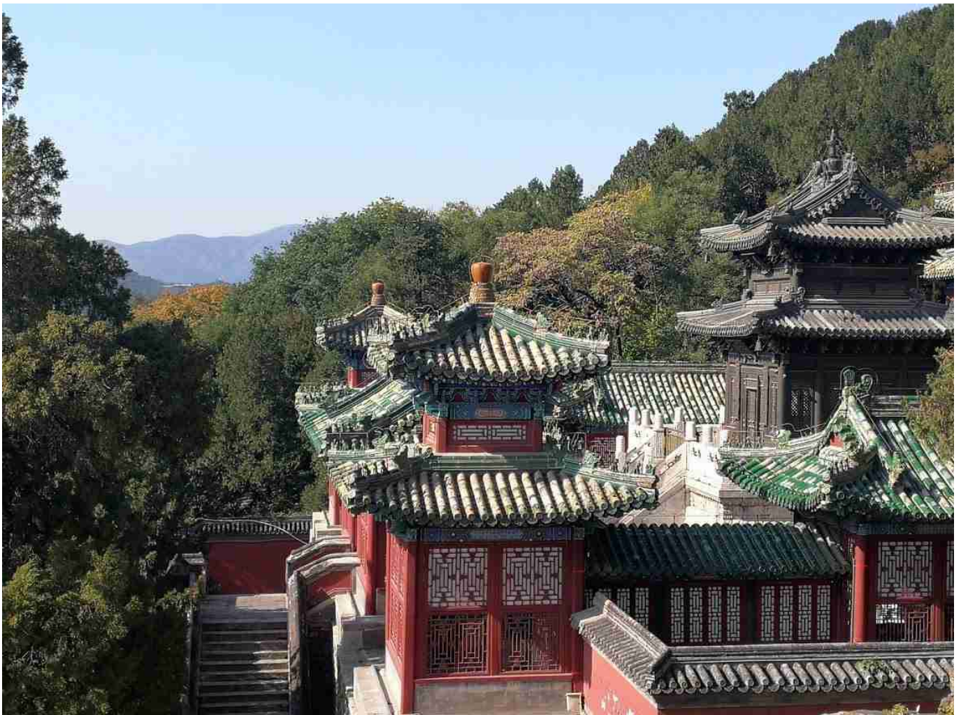
Toits du palais d'été

Nous avons beaucoup aimé le domaine du palais d'été . Arrivez par la porte proche du métro Beigongmen, promenez-vous entre les différents bâtiments qui composent le palais et contournez le lac par l'est ou l'ouest. Admirez les ponts et les pavillons répartis dans le parc, faites un tour en bateau sur le lac. C'est tellement grand que vous ne vous rendez pas compte de la foule de touristes qui visitent le site. C'est un endroit magnifique et reposant.