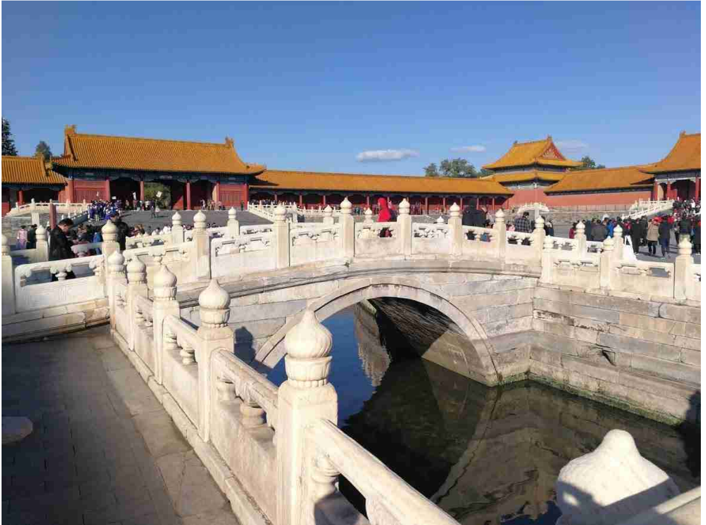
Un pont de la cité interdite