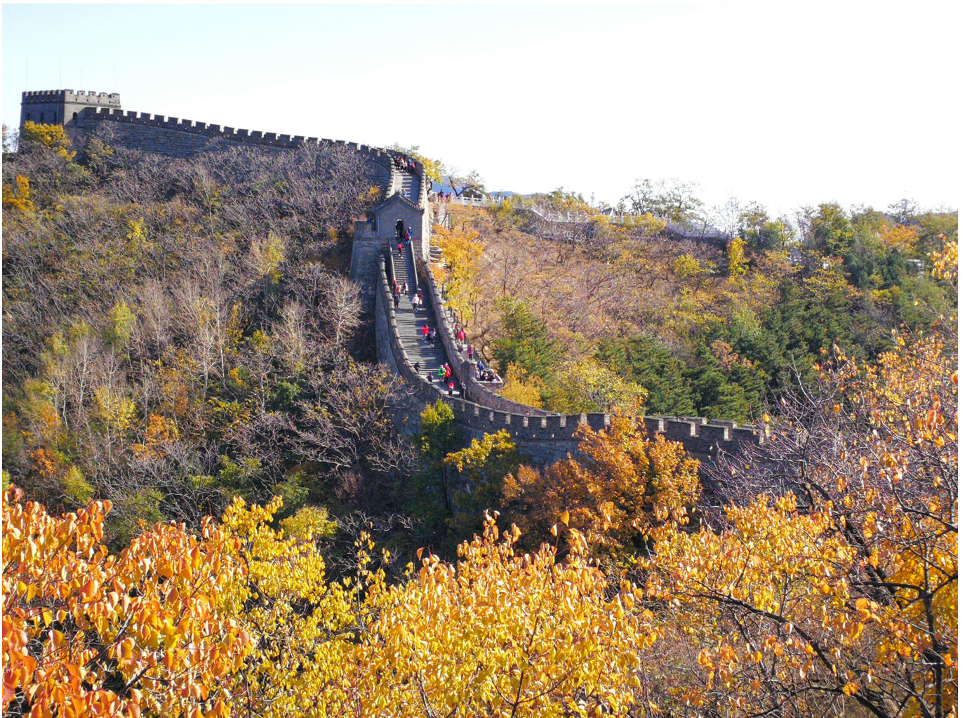
La grande muraille à Mutianyu

Demandez à votre hôtel de vous réserver une voiture avec chauffeur un jour de semaine pour aller sur la Grande Muraille. Il vous faut environ 1h30 de trajet pour aller sur les tronçons de Badaling ou de Mutianyu , les plus proches de Pékin. Vous pouvez monter jusqu'au site en télécabine ou en télésiège à partir de Mutianyu. Ensuite vous passez quelques heures à marcher sur la muraille qui est très bien restaurée. Votre voiture vous attend pour revenir à Pékin, faites vous déposer au parc du palais d'été si vous n'avez pas pu tout voir le jour 2 et si marcher -encore- ne vous fait pas peur.