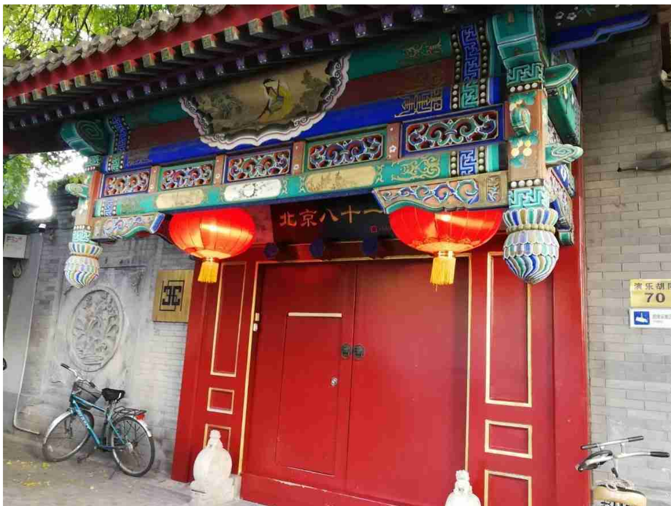
Hotel Côté Cour Beijing

Hôtel recommandé : Hôtel Côté Cour Beijing . Il appartient à une personne passionnée par la France mais qui n'y est jamais allée. Proche des métros et d'un quartier de restaurants dont le fameux canard laqué à la pékinoise. J'aime bien le chat de la maison.