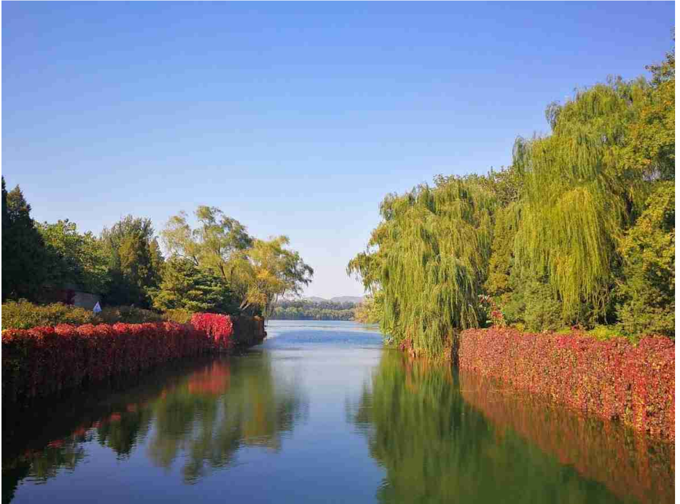
Porte Ouest du palais d'été

C'est parti donc pour Chéri et moi. Nous avons affuté notre chinois, nous savons commander des raviolis, du thé, de la soupe et du canard laqué. Nous arrivons dans notre hôtel, charmante succession de cours dans les hutongs, ces ruelles des vieux quartiers de Pékin.