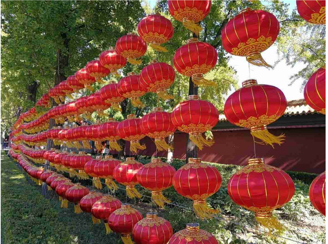
Lampions au parc du temple du ciel