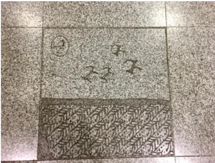
motifs de Sun Yu Li au sol

Ces symboles jalonnent le chemin jusqu'à l'escalator au-dessus duquel on découvre « Universal Language ». Sur cette grande mosaïque de Sun Yu-Li, on retrouve les motifs des poissons, des cerfs et des chasseurs chers à l'artiste.