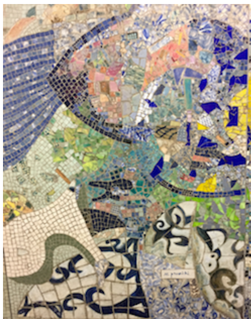
Détails des céramiques de Delia Prvacki