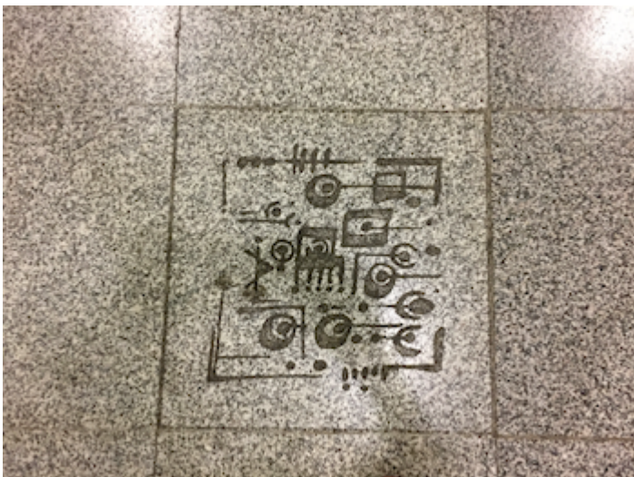
motifs de Sun Yu Li au sol

Le premier artiste que l'on découvre en entrant dans la station Dobhy Gaut est probablement Sun Yu-Li . L'œil est tout d'abord attiré par les motifs «primitifs » présents sur les colonnes et les carrelages représentant des poissons, des chasseurs, des cerfs.