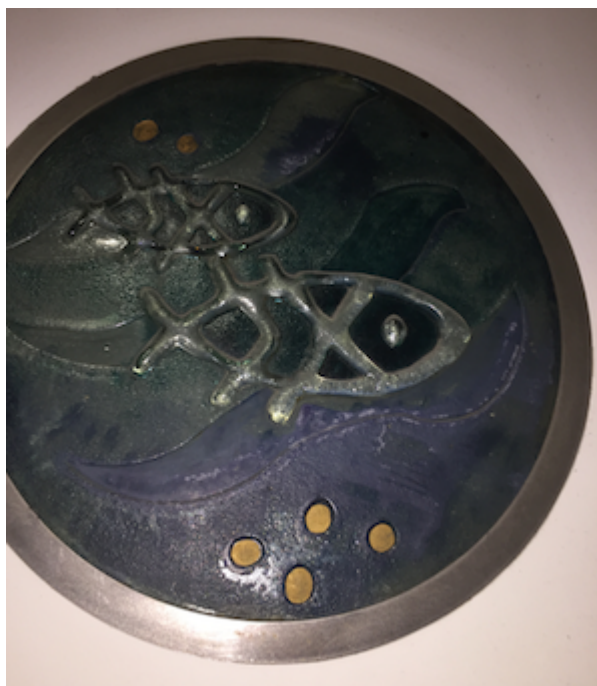
motifs de Sun Yu Li sur une colonne